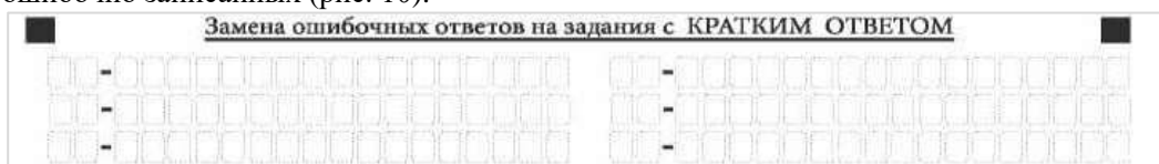
Рис. 10. Нижняя часть бланка ответов № 1 (поле замены ошибочных ответов на задания с кратким ответом)

В нижней части бланка ответов № 1 предусмотрены поля для записи исправленных ответов на задания с кратким ответом взамен ошибочно записанных (рис. 10).