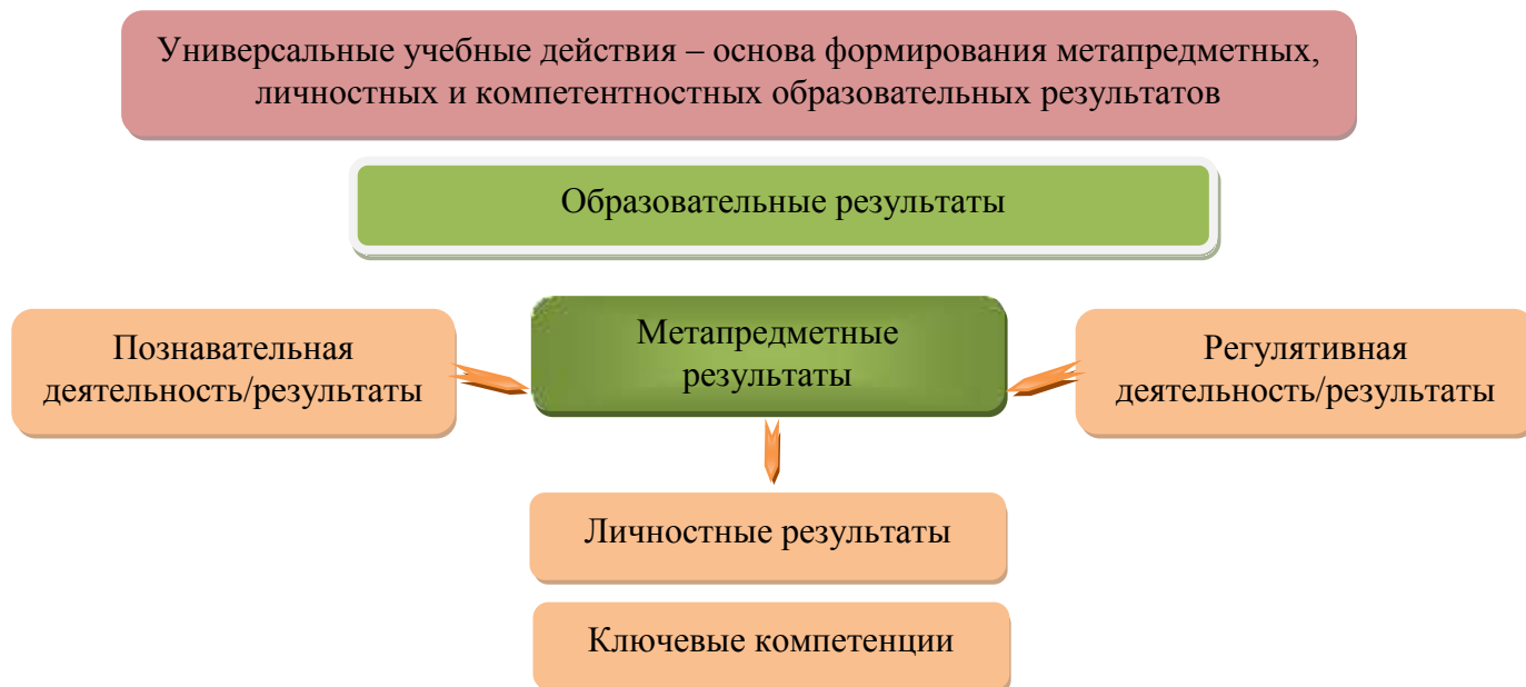
Рис. 3. Система оценки образовательных результатов

Система оценки предусматривает уровневый подход к представлению планируемых результатов и инструментарию для оценки их достижения. Согласно этому подходу за точку отсчёта принимается не «идеальный образец», отсчитывая от которого «методом вычитания» и фиксируя допущенные ошибки и недочёты, формируется сегодня оценка ученика, а необходимый для продолжения образования и реально достигаемый большинством обучающихся опорный уровень образовательных достижений. Достижение этого опорного уровня интерпретируется как безусловный учебный успех ребёнка, как исполнение им требований Стандарта. А оценка индивидуальных образовательных достижений ведётся «методом сложения», при котором фиксируется достижение опорного уровня и его превышение. Это позволяет поощрять продвижения обучающихся, выстраивать индивидуальные траектории движения с учётом зоны ближайшего развития.