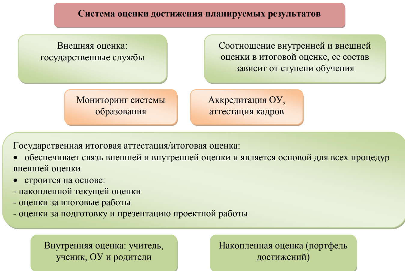
Рис. 2. Система оценки достижения планируемых результатов

В соответствии с ФГОС ООО основным объектом системы оценки результатов образования, её содержательной и критериальной базой выступают требования Стандарта, которые конкретизируются в планируемых результатах освоения обучающимися основной образовательной программы основного общего образования.