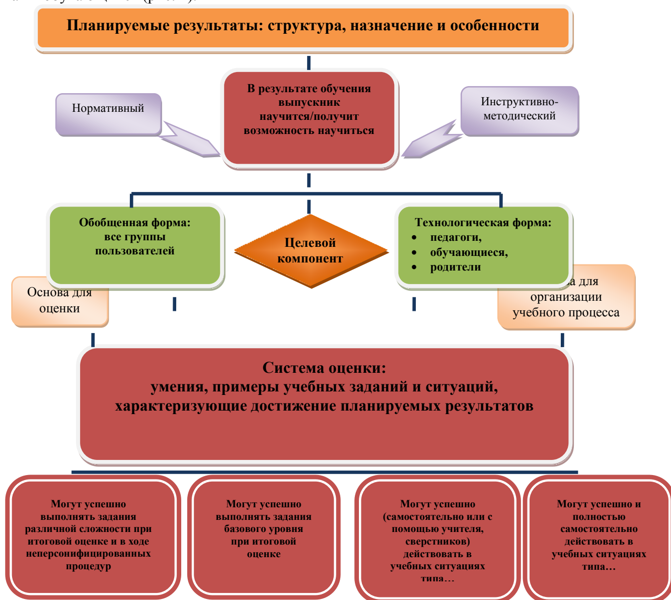
Рис. 1. Особенности структуры планируемых результатов. Функция и назначение

Система оценки достижения планируемых результатов освоения основной образовательной программы основного общего образования (далее – система оценки) представляет собой один из инструментов реализации требований Стандарта к результатам освоения основной образовательной программы основного общего образования, направленный на обеспечение качества образования, что предполагает вовлеченность в оценочную деятельность, как педагогов, так и обучающихся (рис. 1).